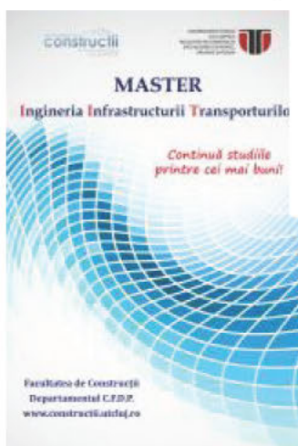
Fata IIT.jpg ~321 KO Arată Descarcă