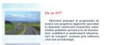
Verso IIT.jpg ~510 KO Arată Descarcă