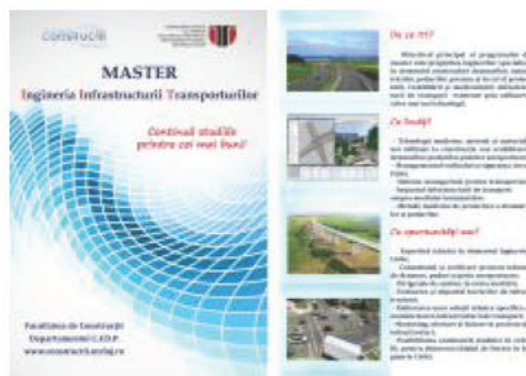
Fata Verso IIT.jpg ~772 KO Arată Descarcă